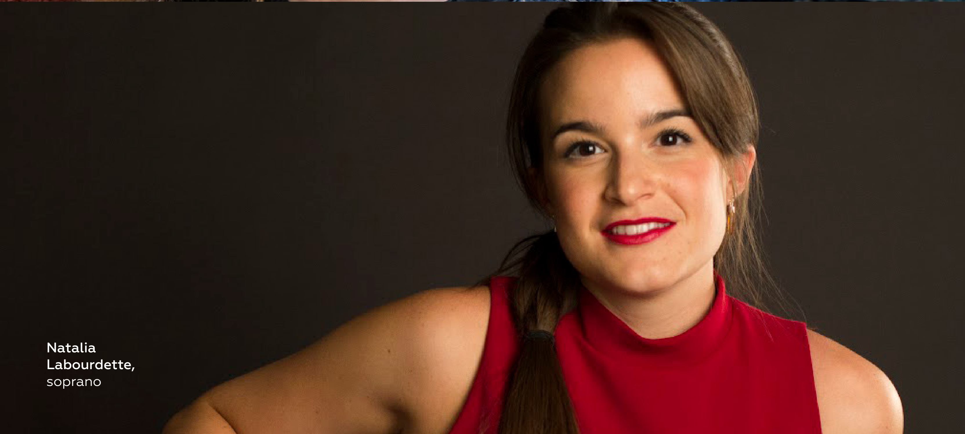
Natalia Labourdette, soprano